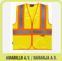
AMARILLO A.V. / NARANJA A.V.