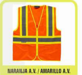
NARANJA A.V. / AMARILLO A.V.