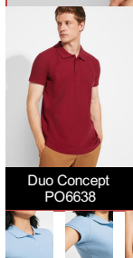
Duo Concept PO6638