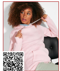
URBAN WOMAN SU1068